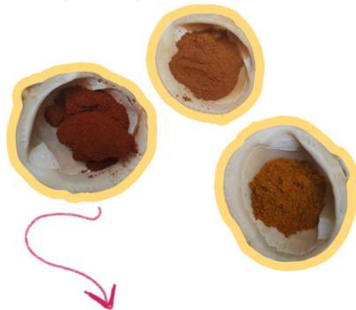
especias o pigmentos